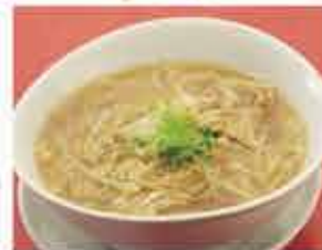
コラーゲンたっぷりふかひれあんかけ麺