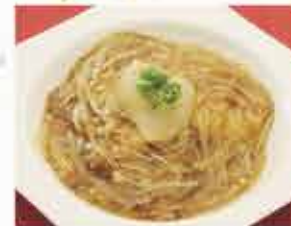
コラーゲンたっぷりふかひれあんかけ飯