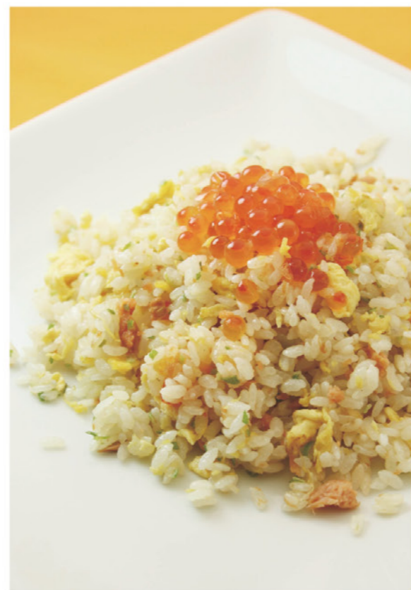
イクラと鮭の親子チャーハン 卵 乳 麦 (スープ付き) ¥990 (税込¥1,089) 海の幸の親子の競演です。