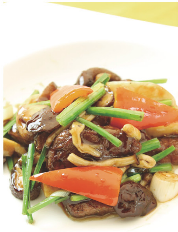
特選牛フィレ肉ときのこの炒め 麦 ¥1,990 (税込¥2,189) 大好評の牛フィレ肉が秋の装いです。