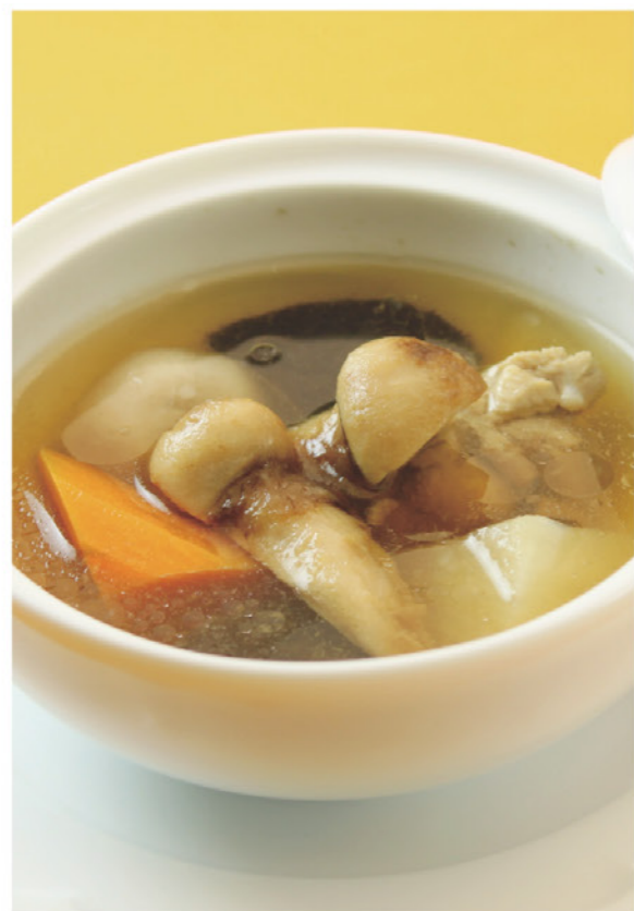
松茸と根菜の澄ましスープ ¥490 (税込¥539) 秋香る、やさしい味のスープです。