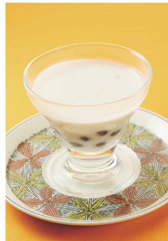
アロエと黒タピオカの 乳 ココナッツミルク ¥390 (税込¥429) アロエとタピオカの二つの食感をお楽しみください。