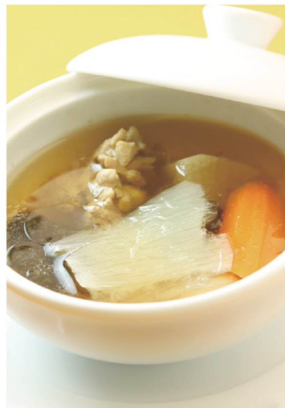
ふかひれと松茸入り季節野菜の 澄ましスープ ¥1,190 (税込¥1,309) 贅沢な優しい味のスープです。