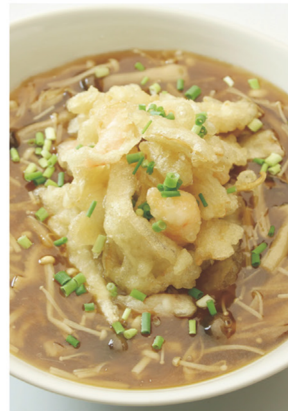
白舞茸の天ぷらあんかけ麺 卵 麦 ¥990 (税込¥1,089) サクサク天ぷらが乗った、きのこのあんかけラーメンです。