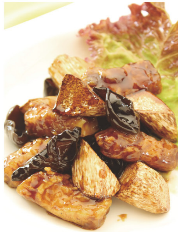
メカジキとマコモ茸の 卵 乳 麦 黒酢仕立て ¥1,190 (税込¥1,309) ふわふわのメカジキとサクサクのマコモ茸の 絶妙なハーモニーをお楽しみください。