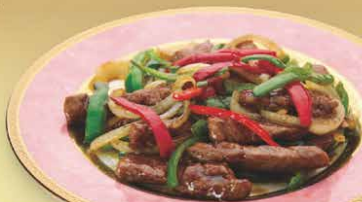
極太牛肉とピーマンの炒め 🍴🍷🍷 ¥1,690 (税込¥1,859)