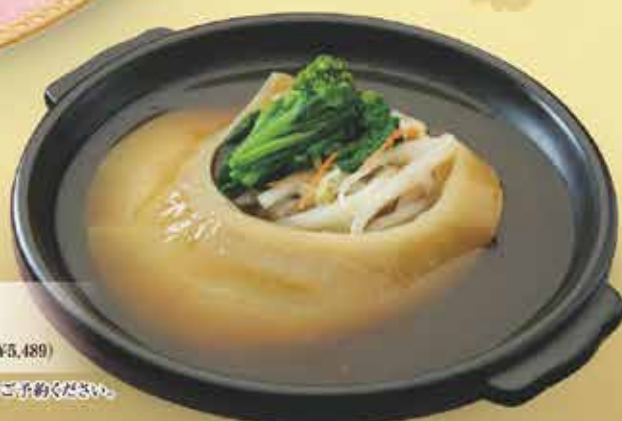
ふかひれの姿煮込み 2~3名サイズ ¥4,990 (税込¥5,489)

※調理にお時間をいただく場合がございます。ぜひご予約ください。 ※野菜は季節によって異なります。